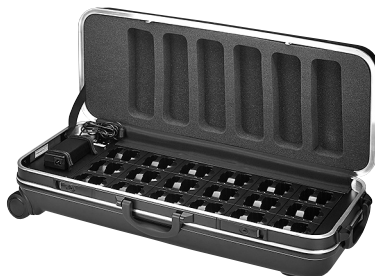
ATS-36C Bestell-Nr. • Order No. 24.4700