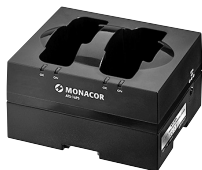
ATS-16PS Bestell-Nr. • Order No. 24.4670